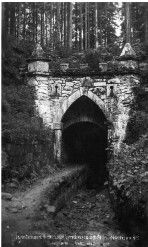
Zadní portál v novogotickém stylu

Tunel byl pak spojen se Starým kanálem příkrou struhou v délce 305 m s velmi příkrým spádem 158,8 promile. Výškový rozdíl dolního portálu k ústí Starého kanálu je tedy kolem 30 m. Zároveň do této strouhy byl