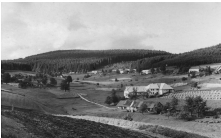
Jelení Vrchy - žně