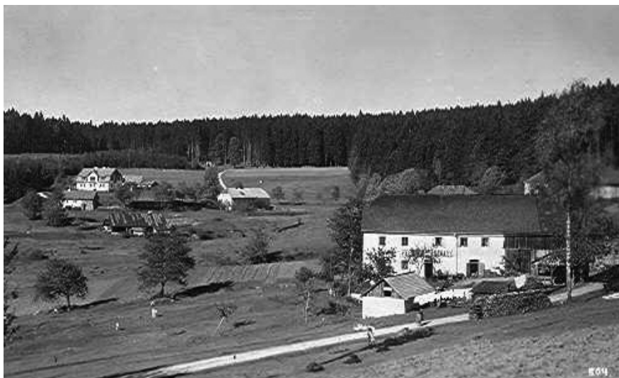
Hospoda U Fechtera

V dnešní době je osídlení (i když nepatrné) soustředěno na západním konci údolí pod dolním portálem. Tyto dvojdomky zde vznikly až v době budování socialismu, kdy zdejší končiny spravovaly vojenské lesy. V dávné době, o které píšeme, byly pod dolním portálem pouze louky, které se táhly až ke Starému kanálu. Ještě před zbudováním Nového kanálu si jelenští (híršperští) obyvatelé na této horské pastvině zbudovali rybník. Rybník byl a je stále na levé straně vedle skluzu kanálu od dolního portálu. Dnes je celé okolí kolem rybníka zarostlé stromy a není vidět ani ze silnice stoupající k dolnímu portálu. Při plavení dřeva byla i jeho voda používána k plavení. Tehdy byl rybník hojně využíván hirsperskou mládeží, ale i turisty k osvěžení a odpočinku po namáhavém výstupu do těchto horských končin. V roce 1924 byl již rybník značně zanesen bahnem a tak jej otcové z Jeleních Vrchů vyhloubili a usazené bahno odvezli. V zimních měsících, kdy hladina rybníka zamrzla, docházelo k jeho odledování. Led byl rozřezán na kostky a ty pak byly na saních odváženy do ledového sklepa restaurace pana Fechtera v čp. 15 k chlazení nápojů v letních měsících. Tehdy byly na Jeleních Vrchích dva hostince, a to u předního a zadního Fechtera.