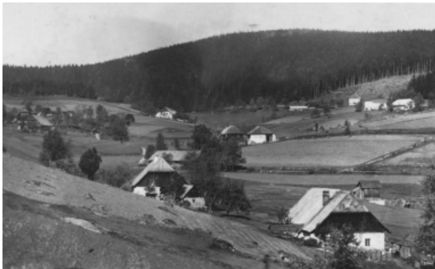
Jelení Vrchy - pohled od Jeleního potoka