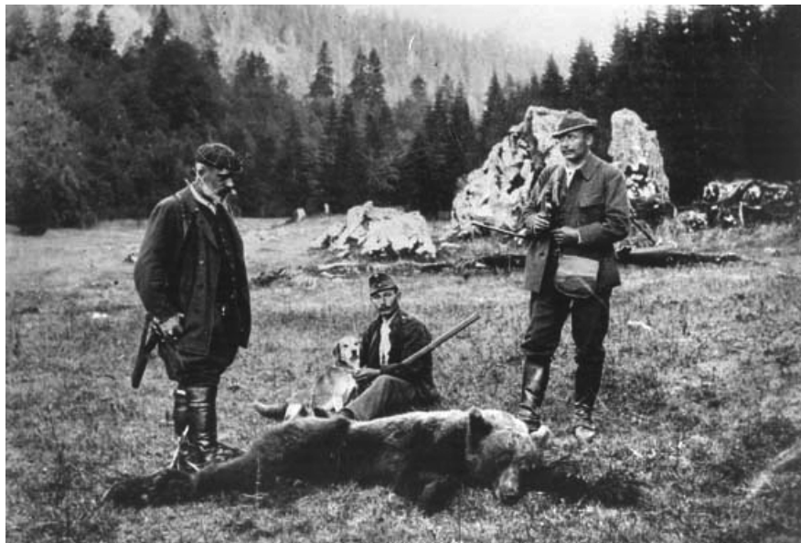
Poslední ulovený medvěd na Šumavě 12. 11. 1856

po tuhé zimě, postupně stářím odumírají a není dnes hospodáře, který by nové vysadil. Mění se doba a také lidé.