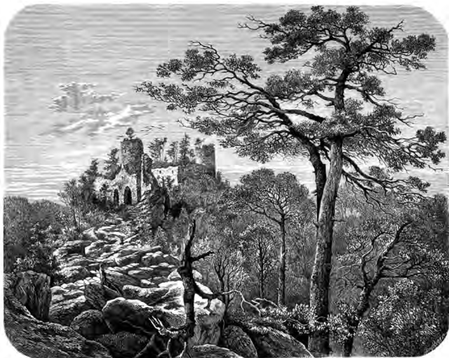
Zříceniny hradu Valdeka na dobové pohlednici

Jako ostatní naše hrady má i Valdek svoji pověst o bílé paní. Vypadá jako mladá dívka, má dlouhé, vlnité blond vlasy, které jí dosahují až na ramena. Oblečena je do průsvitných bílých šatů. Můžeme ji spatřit za slunného jarního dne v pravé poledne pod hradem, jak poskakuje svýma bosýma nohama po sluncem vyhřátých balvanech, směrem od potoka ke hradu. Když je někým pozorována, svůj pohyb zrychluje a postupně se ztrácí. Asi