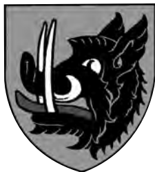
Erb rodu Buziců

„V bráně se opět ohlédl, on a všichni se pak ohlíželi vzhůru po bráně, po břevnu nad ní, na němž trčela useknutá veliká hlava divokého kance, jehož včera skolil. Černala se, štetinatá, mohutného rypáku, ceníc bílé lesklé tesáky a připomínala sílu Bivojovu.“