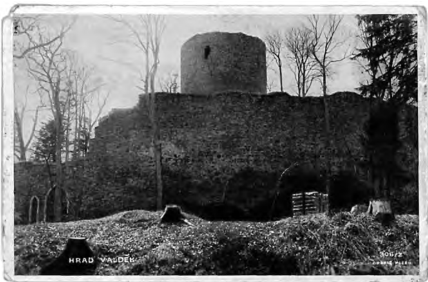
Zříceniny hradu Valdeka na dobové pohlednici

Vstoupila do branky, prošla potichu okolo věže a při vstupu na nádvoří zůstala překvapena. Vlevo byla hradní kuchyně a přímo proti ní veliká